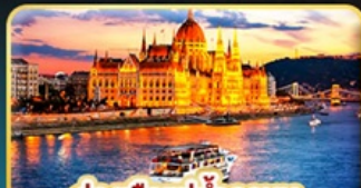
ส่องเรือแม่น้ำดานูบ ช่วง Twilight