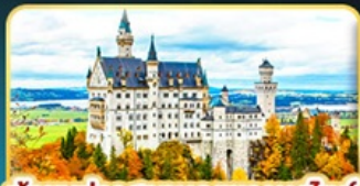
เข้าชมปราสาทนอยชวานสไตน์

คัดสรรความเป็น "ที่สุด" ของยุโรปตะวันออกครบถ้วน