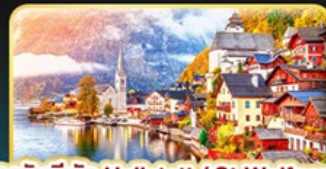
การ์ตูนที่พัก Hallstatt / St. Wolfgang หรือริมทะเลสาบ 1 คืน