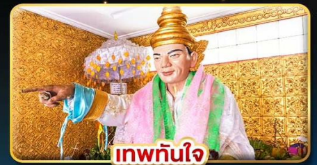
เทพกนิใจ