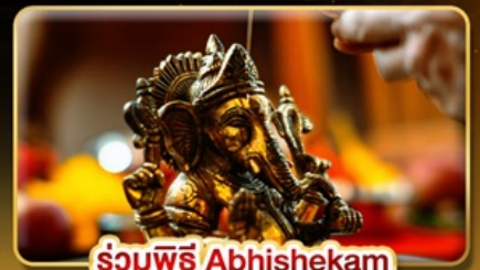
ร่วมพิธี Abhishekam