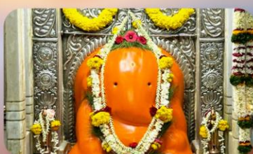
องค์อัยภูวินายัก