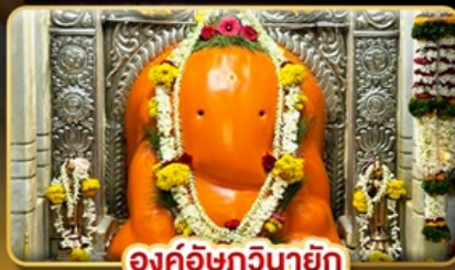
องค์อชฏวินายัก