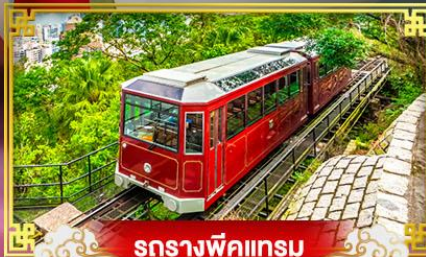
รถรางพิกเกอรัม