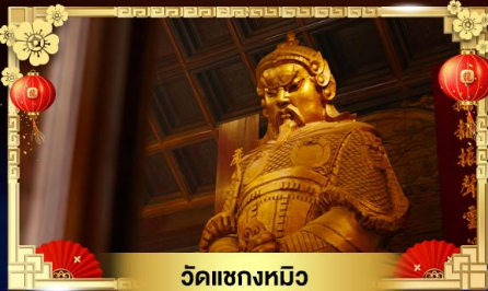
วัดแขกหมิว