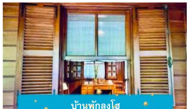
บ้านพักลุงโฮ