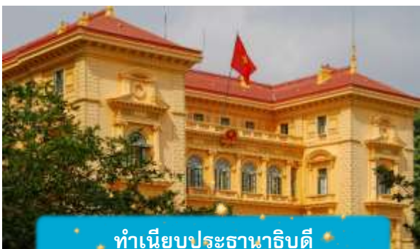
ทำเนียบประธานาธิบดี

เช้า บริการอาหารเช้า ณ ห้องอาหารของโรงแรม นำท่านถ่ายรูปด้านนอก สุสานโฮจิมินห์ จุดเริ่มต้นของการเข้าใจเวียดนาม สถานที่อันเงียบสงบที่สะท้อนจิตวิญญาณของผู้นำผู้ยิ่งใหญ่ สุสานแห่งนี้ไม่ได้เป็นเพียงอนุสรณ์ แต่คือบทเรียนประวัติศาสตร์ที่สัมผัสได้จริง นำท่านเดินทางสู่จุดศูนย์กลางแห่งประวัติศาสตร์เวียดนาม นำชมด้านนอก ทำเนียบประธานาธิบดี อาคารสีเหลืองอร่ามในสไตล์ฝรั่งเศส ที่ยังคงใช้ในพิธีการสำคัญของชาติและชม บ้านพักลุงโฮ บ้านไม้เรียบง่ายริมสระบัว ที่เผยให้เห็นชีวิตสมถะของผู้นำผู้ยิ่งใหญ่ "โฮจิมินห์" สองสถานที่ที่ สองเรื่องราวที่สะท้อนความเป็นเวียดนามอย่างลึกซึ้ง ไม่ใช่แค่ท่องเที่ยว แต่คือการเข้าใจจิตวิญญาณของประเทศนี้อย่างแท้จริง เที่ยง บริการอาหารกลางวัน ณ ภัตตาคาร