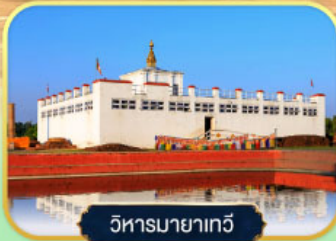
วิหารมายาเทวี