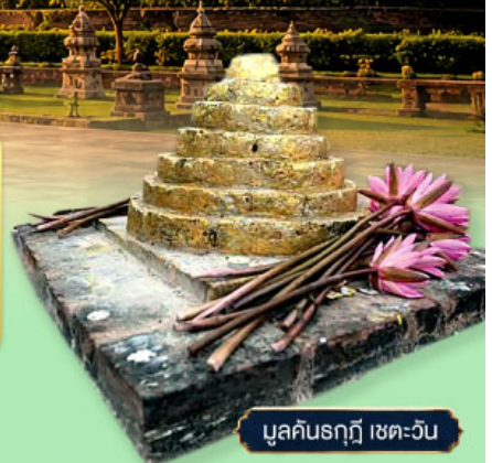
มุลคินรุฎี เขตะวัน