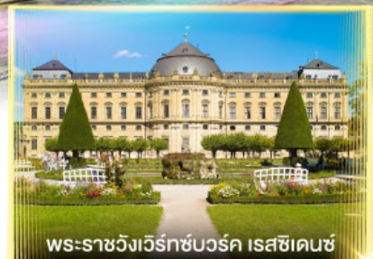
พระราชวังแวร์ซายส์ กรุงเวียนนา