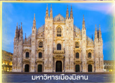
มหาวิหารเมืองมิลาน