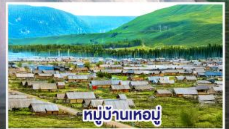
หมู่บ้านทอมู่