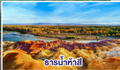
ธารน้ำห้ำสี