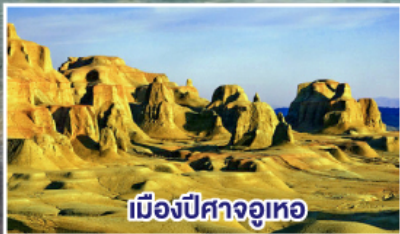
เมืองปิสางจูเหอ