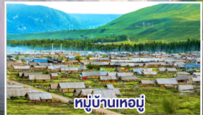
หมู่บ้านเหมอู๋

เดินทาง 10-17, 17-24, 05-12 มี.ย. 69 14-21 มี.ย. / 24 มี.ย.-01 ก.ค. 69