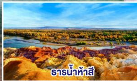
ธารน้ำห้าสี