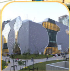
ไร้ละคร แท้งชาติไถจง