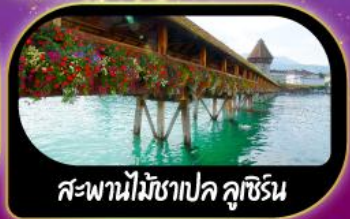
สะพานไม้ชาเปล คูชีริน