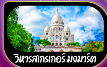
วิหารสกรกอร์ มงมาร์ต