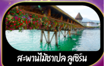
สะพานไม้ชาเปล คูชีริน