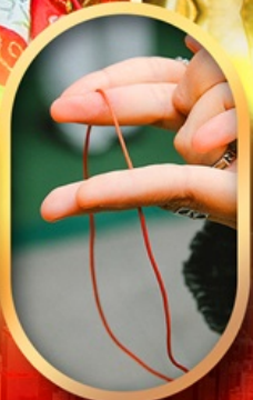
เสริมดวงความรัก