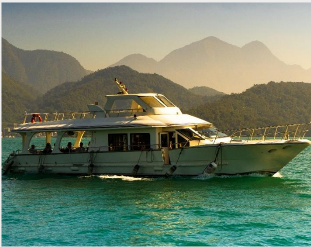
ล่องเรือทะเลสาบสุริยันจันทรา (Sun Moon Lake)

นำท่านเดินทางสู่ วัดพระถังซำจั๋ง (Xuanguang Temple) นมัสการพระอัฐิของพระพุทธเจ้าที่อันเชิญมาจากชมพูทวีป เป็นอีกวัดหนึ่งที่ต้องมาเยือนหากได้มาที่ทะเลสาบสุริยันจันทรา วัดนี้มีรูปปั้นพระถังซำจั๋งให้นมัสการ อีกทั้งมีวิวทะเลสาบที่สวยงาม และพิพิธภัณฑ์ที่จัดแสดงประวัติของพระถังซำจั๋ง ภายในวัดมีบรรยากาศที่สวยงาม เงียบสงบ