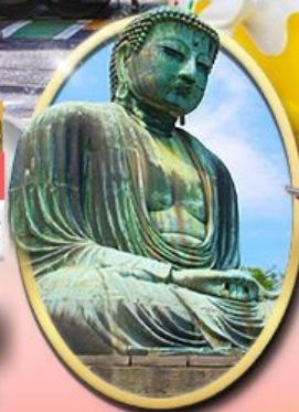
พระใหญ่คามาคุระ