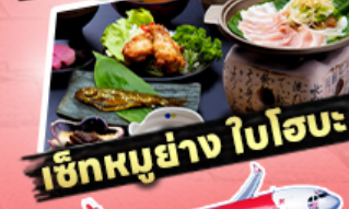
เช็กนุ้ย่าง ใบโอบะ