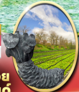
ฟาร์ม วาซาบิ ไดโอะ

รหัสทัวร์ RJ-XJ121 เดินทาง 6D 4N เมษายน - มิถุนายน 69