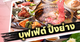
บุฟเฟ่ต์ บิงย่าง