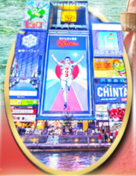
ซอปปิง ซินโซบาชิ