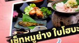
เช็กเอาท์ ใโฮะ