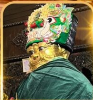
แม่ยี่กัษ