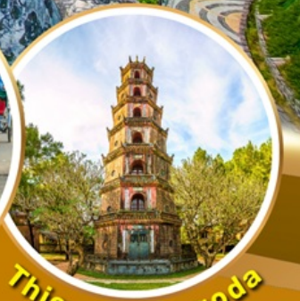
Thien Mu Pagoda

VIETNAM AIRLINES น้ำหนักกระเป๋า 23 กิโล พักรักษา 4 ดาว รวมประกันเดินทาง แจกหมวกคนละ 1 ใบ