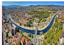
เมืองนิส