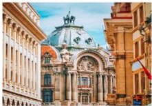
เมืองบูคาเรสต์

05.45 น. เดินทางถึงสนามบินอิสตันบูล แวะเปลี่ยนเครื่อง 06.50 น. ออกเดินทางสู่เมืองบูคาเรสต์ ประเทศโรมาเนีย เที่ยวบิน TK1043 08.10 น. เดินทางถึงสนามบินเฮนรีค็อนดา