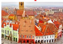
เมืองซีบีอู