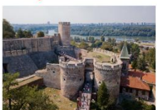
ป้อมปราการเบลเกรด ถนน Knez Mihailova

** พักที่ Abba Hotel 4* หรือเทียบเท่า **