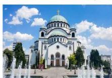
วิหารเซนต์ซาวา