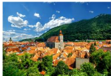
เมืองบราซอฟ