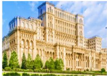
อาคารรัฐสภา

** พักที่ Hotel Pullman Bucharest 4* หรือเทียบเท่า **