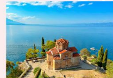
St. John at Kaneo Church ป้อมปราการซามูเอล

** พักที่ Hotel Holiday Inn 4* หรือเทียบเท่า **