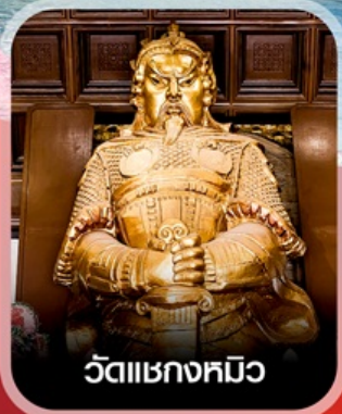
วัดแซกทมิว