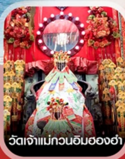
วัดเจ้าแม่กวนอิมของฮ่า

✈️ คอนเฟิร์มออกเดินทาง ✈️ ทุกพีเรียด 2 ท่านขึ้นไป