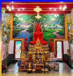
วัดบางพรหม