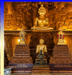
วัดบางкенอย