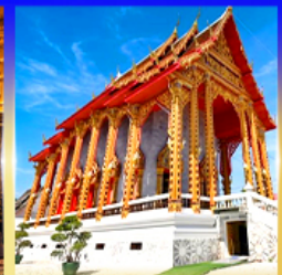
วัดอินทราราม