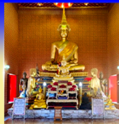
วัดทองคอง