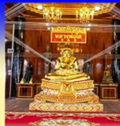
วัดเกษมสรณาราม