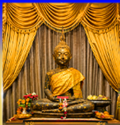
วัดพนมรัตนกิจทอง