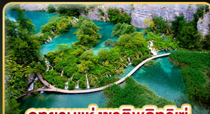
อุทยานแห่งชาติพลิวิเซ่