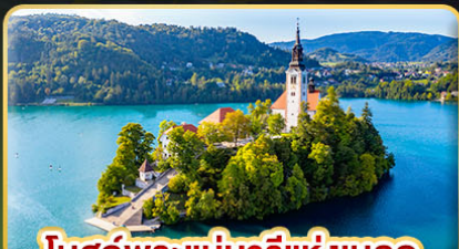
โบสถ์พระแม่มาเรียแห่งเบลด