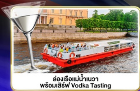
ล่องเรือแม่น้ำนาวา พร้อมลิ้มรส Vodka Tasting