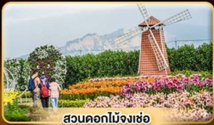
สวนดอกไม้จงเซ่อ