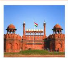
♥♥♥ Agra Fort