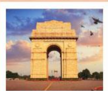
♥♥♥ India Gate