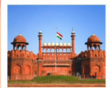
♡♡♡ Agra Fort