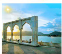
Ana Sagar Lake