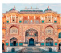
♡♡♡ Amber Fort