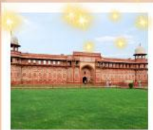
Ajmer Sharif Dargah