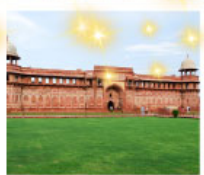
Ajmer Sharif Dargah