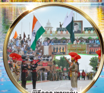
พิธีลดธงชัยแดน อินเดีย-ปากีสถาน ด้านวากาห์

บินภายใน-กลับ DEL ATO IXC DEL หนังผลไม้สด