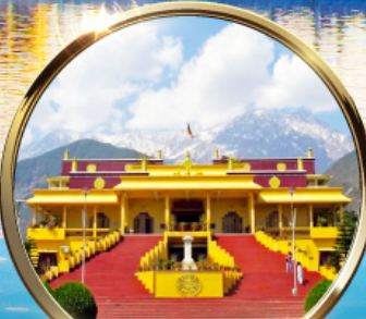
ดาริมซาล่า "ธรรมศาลา" ตำหนักองค์ดาโลลามะ