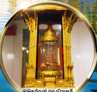
พิพิธภัณฑ์ กรุงนิวเดลี กราบนมัสการพระบรมสารีริกธาตุ