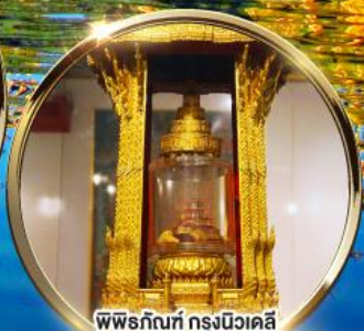
พิพิธภัณฑ์ กรุงนิวเดลี กราบมัสการพระบรมสารีริกธาตุ