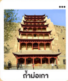
ถ้ำมอเกา