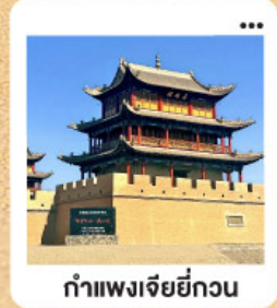
กำแพงเจียกวน