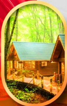
นิงเกิลทอรัส