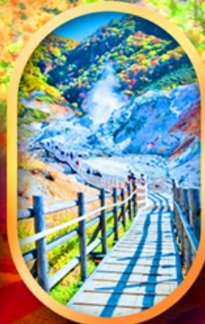
หุบเขานรกจิกุคุดามิ