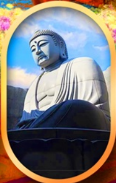
เนินเงาแห่งพระพุทธรเจ้า