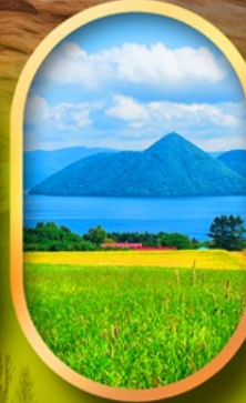
ทะเลสาบโทโยะ