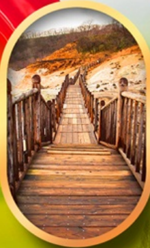
หุบเขาจิทอกุดานิ