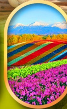
สวนดอกไม้ซึกิโซ