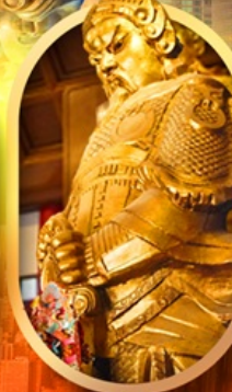
ขอพรวัดแซง

เที่ยว 2 ประเทศ ขอพร วัดดัง ช้อปปิ้งจุใจ