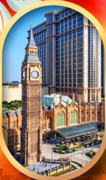
ลอนดอนเนอส์

เที่ยวคุ้ม!! บินเข้าฮ่องกง กลับมาเที่ยว บินเข้ากลับดีด