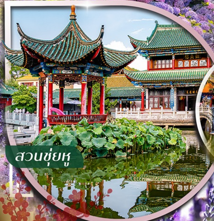
สวนชู้หู