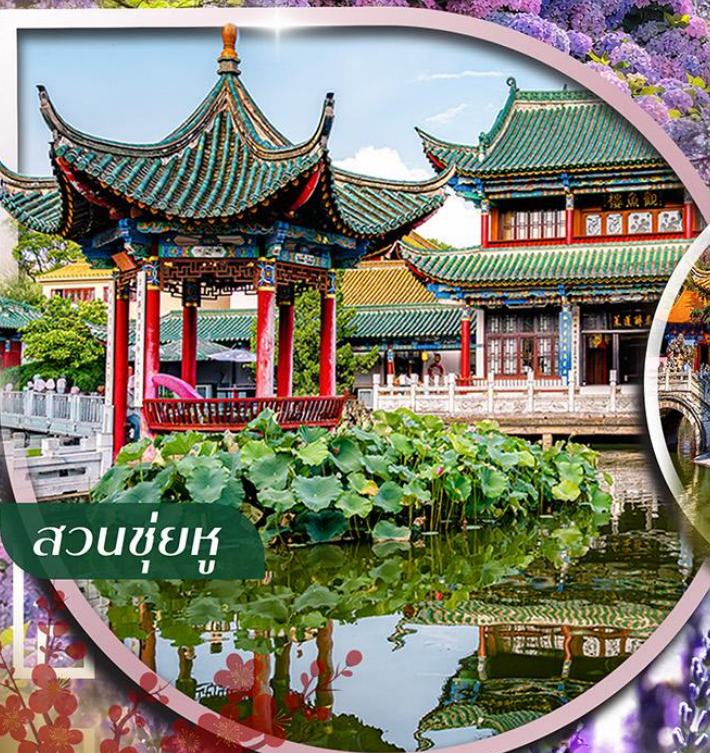
สวนชู่ฮู