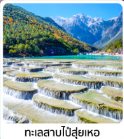
ทะเลสาบไป๋สือเหอ

ไฮไลท์! เที่ยวครบ คุณหมิง ต้าหลี่ ลี่เจียง แชงกรีล่า นั่งกระเช้าขึ้นภูเขาหิมะมังกรหยก ชมโชว์ "Impression of Lijiang"