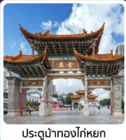
ประตูม้าทองโก่หยก