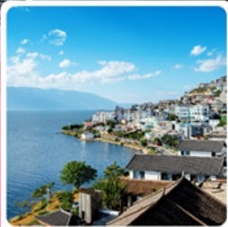
โค้งตัว S ทะเลสาบเอ๋อร์ไห่