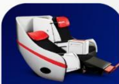
ที่นั่งพรีเมียมแพลตฟอร์ม

บริการอาหารร้อน และ น้ำดื่ม บนเครื่อง ขาไป และ ขากลับ