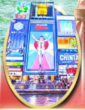
ซ็อบบิง ซินโซบาชิ