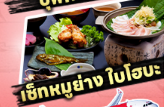
เช็กนุ้ย่าง ใบโอบะ