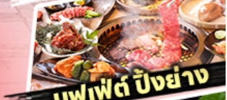
บุฟเฟต์ ปังย่าง