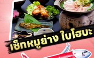
เช็กเอาท์ ใโฮะ