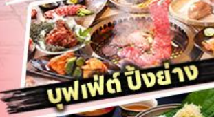
บุฟเฟต์ ปิงย่าง