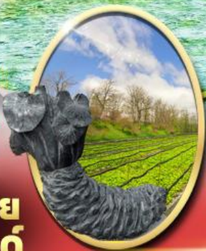
ฟาร์ม วาซาบิ ไดโอะ

รหัสทัวร์ RJ-XJ121 เดินทาง 6D 4N เมษายน - มิถุนายน 69