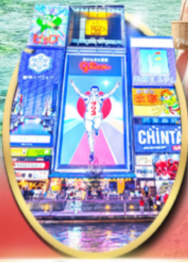
ซอปปิง ซินโซบาชิ