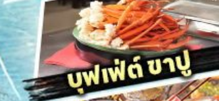
บุฟเฟต์ ซาปู