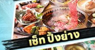
เซ็ท บิงย้าง