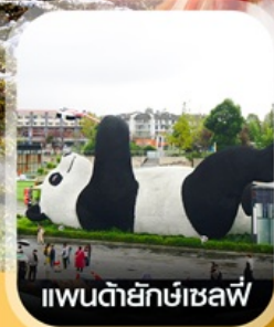
แพนด้ายักษ์เซลฟี

คอนเฟิร์มออกเดินทาง ทุกพีเรียด 2ท่านขึ้นไป