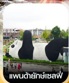
แพนด้ายักษ์เซลฟี

✈️ คอนเฟิร์มออกเดินทาง ✈️ ทุกพีเรียด 2 ท่านขึ้นไป