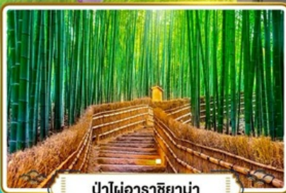
ป่าไผ่อาราชิม่า

เที่ยวโตชิราคาว่าโกะ ทาคายาม่า | 5 วัน 3 คืน