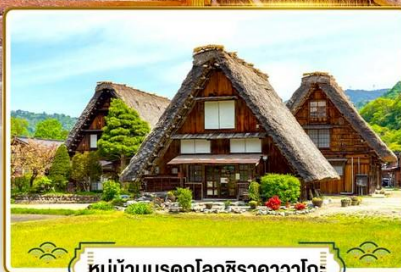
หมู่บ้านมรดกโลกชิราคาวาโกะ

✓ ซ้อปั้งย่านอิทที่สุคในโอซาก้า "ชินโซบาชิ"