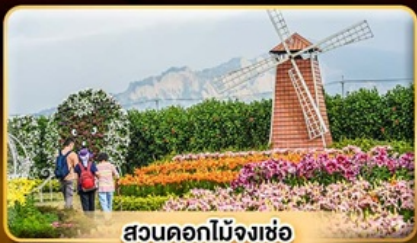
สวนดอกไม้จงเซ่อ