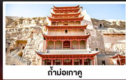
ถ้ำม่อเกาถู