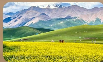
ทุ่งหญ้าซีเหลียน