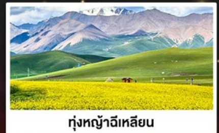
ทุ่งหญ้าฉีเหลียน