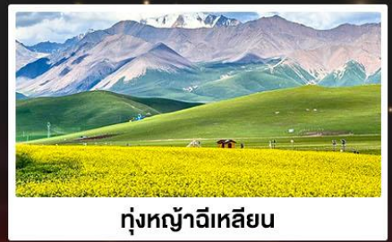
ทุ่งหญ้าจีเหลียน