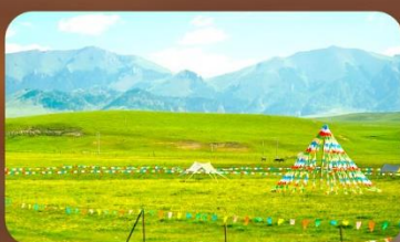
ทุ่งหญ้าออร์คอส