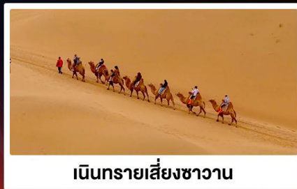
เป็นทรายเสียงซาวาน