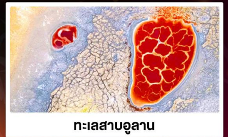
ทะเลสาบอูแลาน