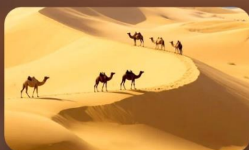
เนินทรายสี่งชวาน