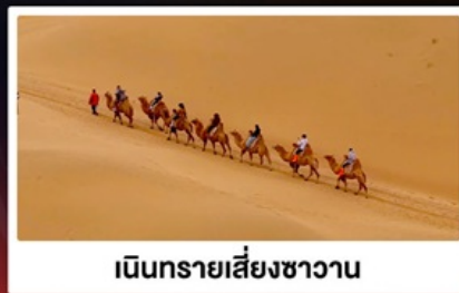
เนินทรายเสี่ยงซาวาน