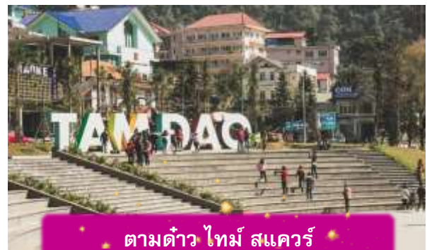
ตามด้าว ไทม์ สแควร์

อิสระท่าน ตลาดกลางคืนตามด้าว เมื่อแสงแดดลับขอบเขา เมืองบนดอยแห่งนี้จะค่อย ๆ เปลี่ยนบรรยากาศเป็นความคึกคักแบบเรียบง่าย ตลาดกลางคืนตามด้าวเต็มไปด้วยของกินพื้นเมือง กลิ่นหอมของหมูย่าง ไชนักรักษา และข้าวโพดย่างลอยคลุ้งไปทั่ว นักท่องเที่ยวเดินจับจ่าย พุดคุย และหยุดถ่ายรูปตามแสงไฟที่ประดับอยู่ทั่วตลาด บรรยากาศเป็นกันเองและอบอุ่น เหมาะกับการเดินเล่น ปิดท้ายวันด้วยความสุขเล็กๆ ๆ ที่สัมผัสได้