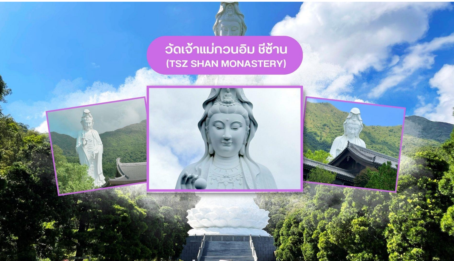
วัดเจ้าแม่กวนอิม ีซ่าน (TSZ SHAN MONASTERY)

4. ขั้นตอนสุดท้าย คือ นำกระดาษในชุดไหว้ไปเผา ซึ่งจะมีเจ้าหน้าที่รอรับกระดาษอยู่หน้าเตาเผาบริเวณลานวัด สามารถนำกระดาษส่งให้เจ้าหน้าที่ได้เลย เป็นอันเสร็จพิธี