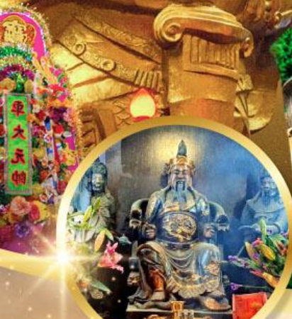
วัดปึกโต

เสริมโชคลาภนำความรุ่งเรือง ทุกด้านของชีวิต