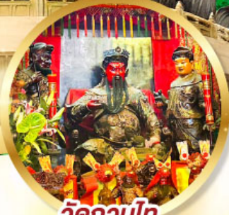
วัดกวนไท

ขอพรเจ้ากวนอู ความซื่อสัตย์ เงินทอง ธุรกิจมั่นคง