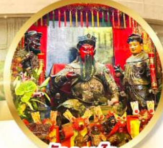
วัดกวนไท่

ขอเทพเจ้ากวนอู ความซื่อสัตย์ เงินทอง รุ่งเรืองมั่นคง