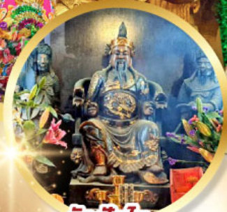
วัดบิกโต

เสริมโชคลาภนำความรุ่งเรือง ทุกด้านของชีวิต