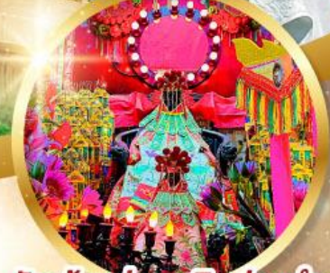
วัดเจ้าแม่กวนอิมฮ่องกง

ขอเทพเจ้ากวนอู ความซื่อสัตย์ เงินทอง รุ่งเรืองมั่นคง