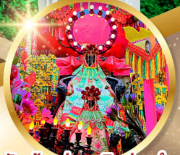
วัดเจ้าแม่กวนอิมฮ่องกง

ขอพรเจ้ากวนอู ความซื่อสัตย์ เงินทอง ธุรกิจมั่นคง