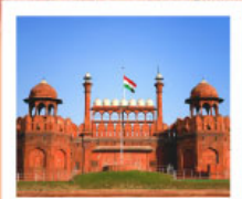
♡♡ Agra Fort