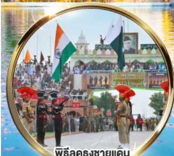
พิธีฉลองชายแดน อินเดีย-ปากีสถาน ด้านวากาห์

บินภายใน-กลับ DEL ATO IXC DEL หนังไม่แห้ง