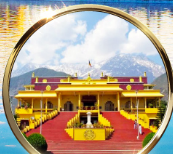
ดาริมซาล่า "ธรรมศาลา" ตำหนักองค์ดาโลลามะ