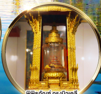
พิพิธภัณฑ์ กรุงนิวเดลี กราบนมัสการพระบรมสารีริกธาตุ