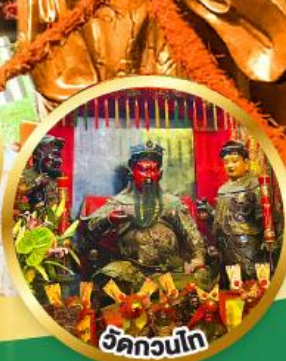
วัดกวนโก