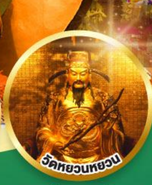
วัดหยวนหยวน

ขอพรเรื่องสุขภาพ, โชคลาภ ความเจริญก้าวหน้า