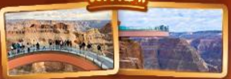
ชมความยิ่งใหญ่ของ GRAND CANYON WEST SKYWALK