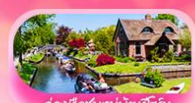
ล่องเรือชมหมู่บ้านทิวริช