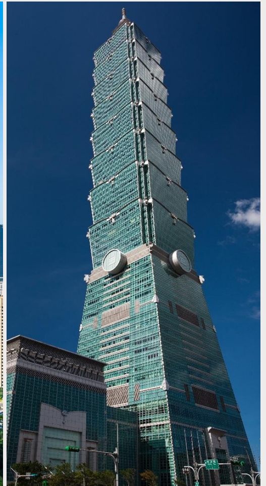
ตึกไทเป 101 (Taipei 101)