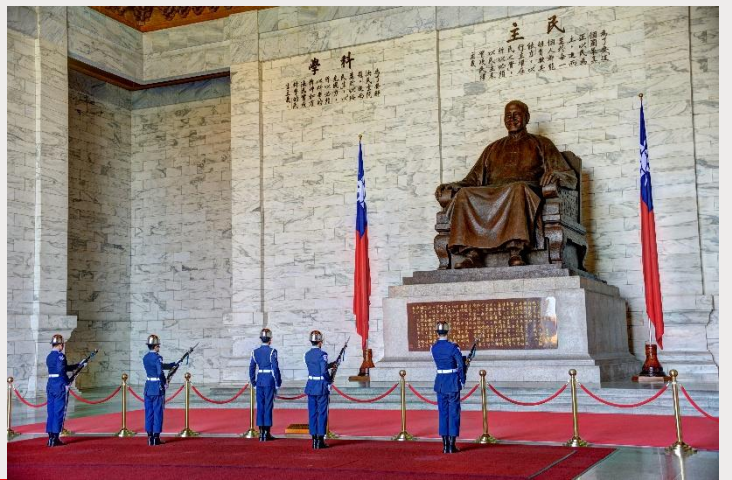
อนุสรณ์สถานเจียงไคเช็ค (Chiang Kai-Shek Memorial Hall)

จากนั้นนำท่านถ่ายรูปกับ ตึกไทเป 101 (Taipei 101) ตึกระฟ้าที่สูงที่สุดในไต้หวัน และเคยเป็นตึกที่สูงที่สุดในโลกในปี ค.ศ. 2004 ความสูงจากพื้นดิน 509.2 เมตร มีทั้งหมด 101 ชั้น ชั้น 1-5 จะเป็น ส่วนของห้องสรรพสินค้าและร้านอาหารต่างๆ โดยมีสินค้ามากมายให้ท่านเลือกซื้อป ทั้งสินค้าทั่วไป