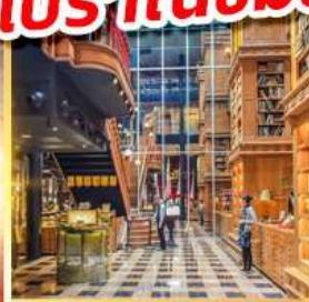
ร้านไอศกรีมมียาฮาร่า