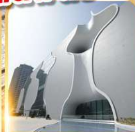
โรงละครไถจง