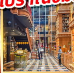
ร้านไอศกรีมมียาฮาร่า