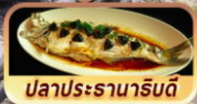
ปลาประจานาโรยดี