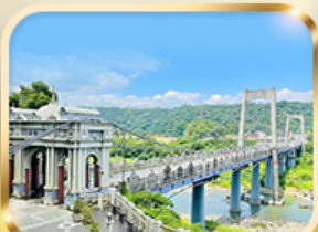
สะพานต้าซี เกาะหยวน