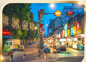
หนิวเซี่ย ไท่มาร์เก็ต