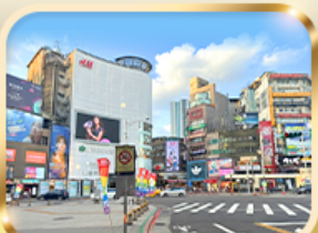
ช้อปปิ้งย่านซีเหมินติง